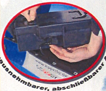
Herausnehmbarer, abschließbarer Akku

SCOOODY 20/35* Scoody- unser Leichtgewicht mit optimalsten Fahreigenschaften und „leichtfüßigem“ Preis